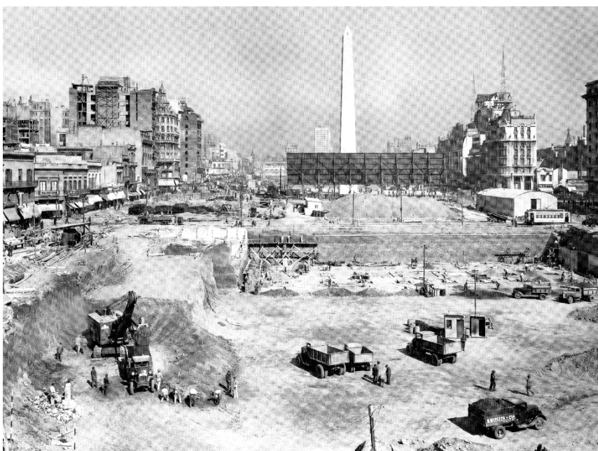
Construcción de la avenida 9 de julio, 1937 (autor desconocido), Colección Dirección de Paseos, Museo de la Ciudad.