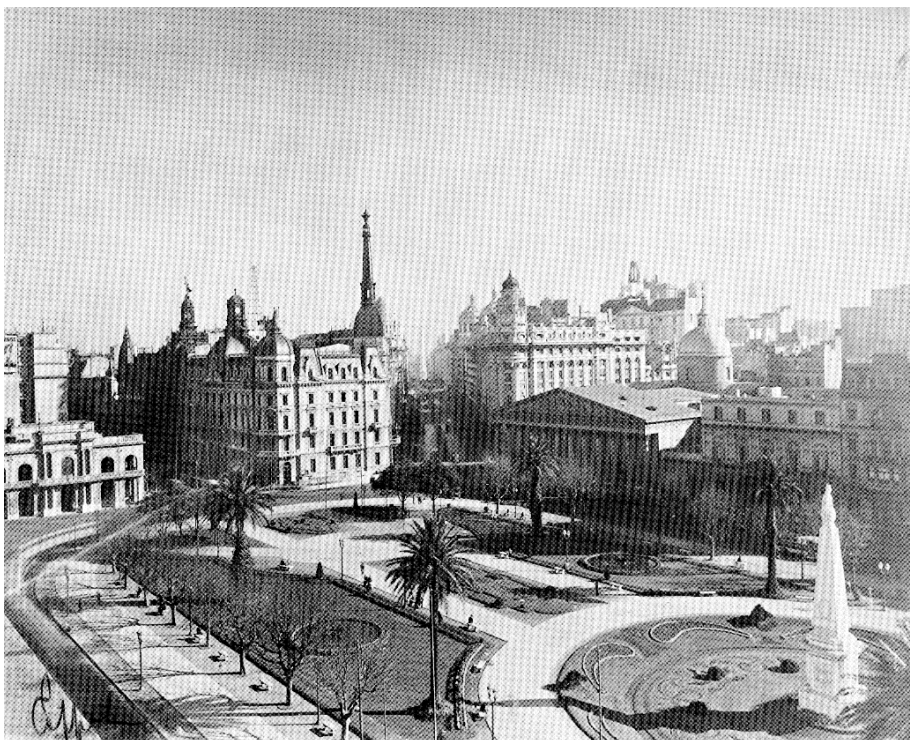
Horacio Cópola, Plaza de Mayo, 1936. Fotografía publicada en el álbum de Coppola, Buenos Aires 1936 , Buenos Aires, MCBA, 1936. Se ve bien el vínculo buscado entre la Pirámide de Mayo y el Obelisco a través de la Diagonal Norte, un vínculo forzado por la perspectiva aérea, en realidad, ya que el eje de la Diagonal no conecta ambos monumentos.

Y allí juega su papel el Obelisco: su geometría esencial y despojada busca dialogar, a través de la flamante Diagonal Norte, de fachadas uniformes y también despojadas, con la Pirámide de Mayo, una conexión mencionada por varios comentaristas entonces y materializada en una de las más logradas fotografías de Horacio Coppola, el fotógrafo de vanguardia a quien, en 1936, como parte de la celebración del cuarto centenario, se le encargó el álbum de Buenos Aires.