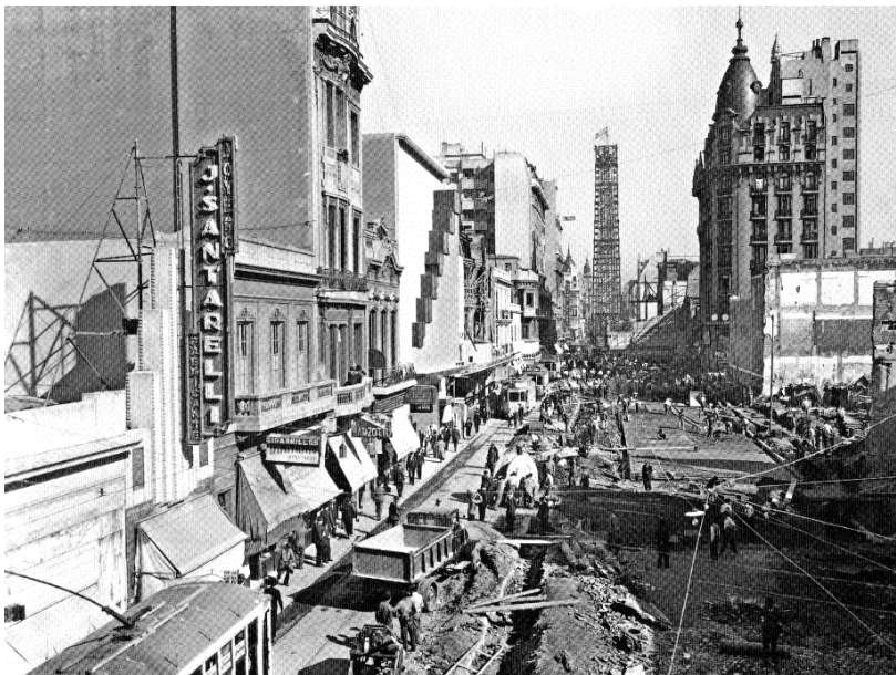
Ensanche de la calle Corrientes, con el obelisco en construcción al fondo, abril de 1936 (autor desconocido), Colección Dirección de Paseos, Museo de la Ciudad.

había formulado como tal, y por medio de ese artificio interpretativo, no sólo le dio un linaje prestigioso a su propio conglomerado de reformas, sino que le atribuyó un significado superior, colocándolo como la culminación de un ciclo. Para ello, De Vedia se propuso –y logró con gran eficacia– terminar una serie de iniciativas pendientes, no todas de la época de Alvear, sino algunas anteriores y muchas otras posteriores a ella, como el ensanche de las avenidas desde el río hasta Callao (el ensanche desde Callao hacia el oeste lo había decidido Rivadavia), la finalización de las diagonales norte y sur que habían estado varios años detenidas, el inicio de la 9 de julio, la finalización de la avenida Costanera, el completamiento de la red de subterráneos, la rectificación del Riachuelo reemplazando todos los puentes antiguos, el entubamiento del arroyo Maldonado y el completamiento de la infraestructura de servicios y del trazado de las calles en toda la extensión de la capital.